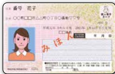
На лицьовій стороні: