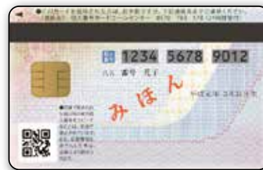
На обороті картки