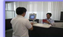
③ 入国審査・上陸許可